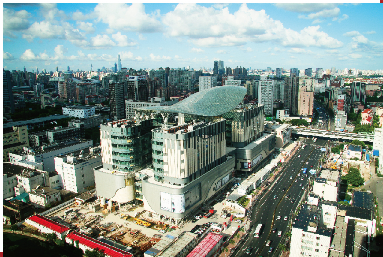
上海徐汇日月光中心（公司第11项经部承建）