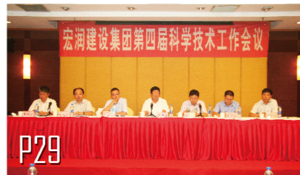
2016年8月26日，宏润集团召开第四届科学技术工作会议。