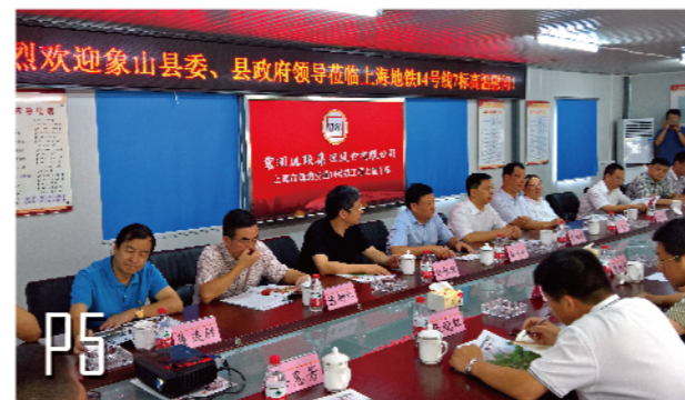
2016年8月19日，象山县领导慰问上海地铁14号线7标项目部。